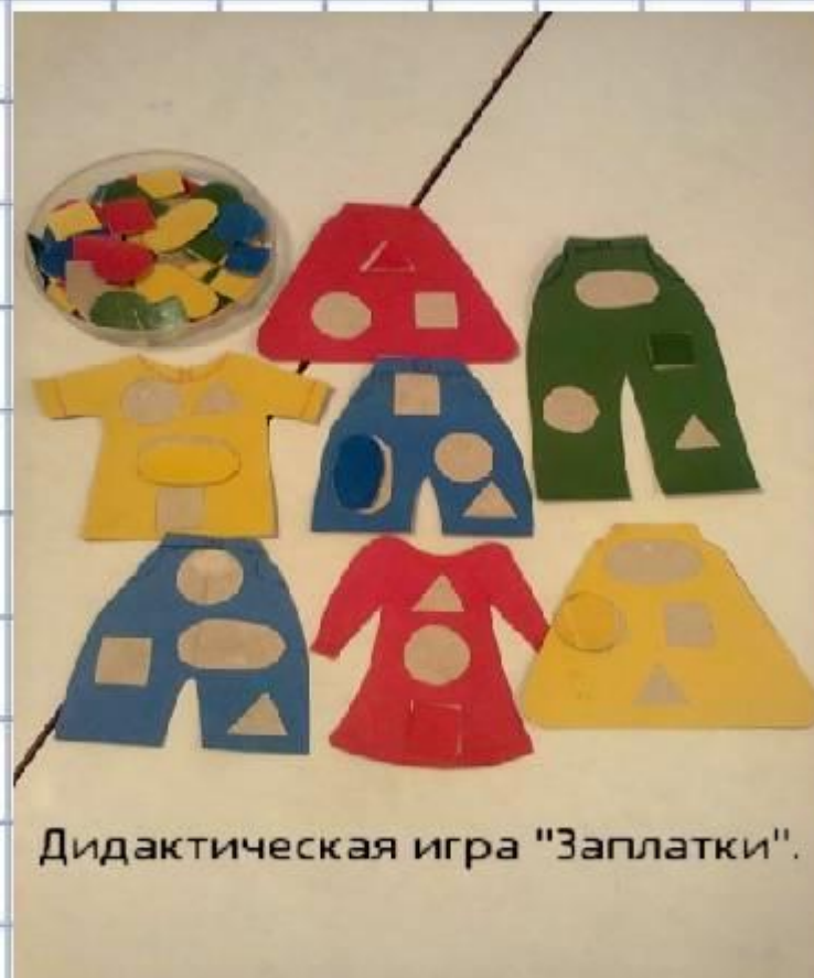
Дидактическая игра "Заплатки".