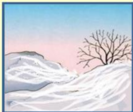
Снег покрыл землю