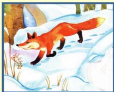
Звери меняют шубки