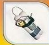
самодельное взрывное устройство