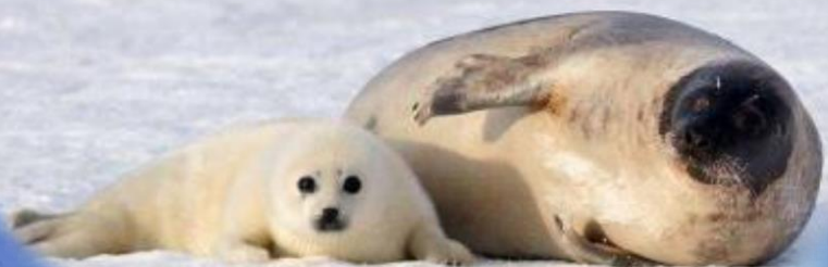
у тюленя – тюленёнок