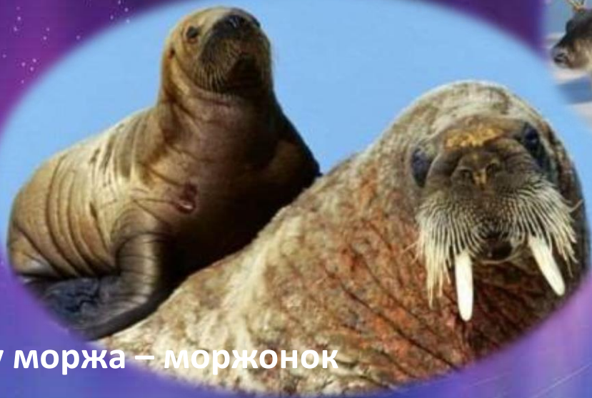
у моржа – моржонок